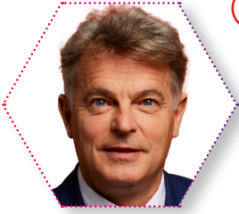
Fabien ROUSSEL secrétaire national du PCF